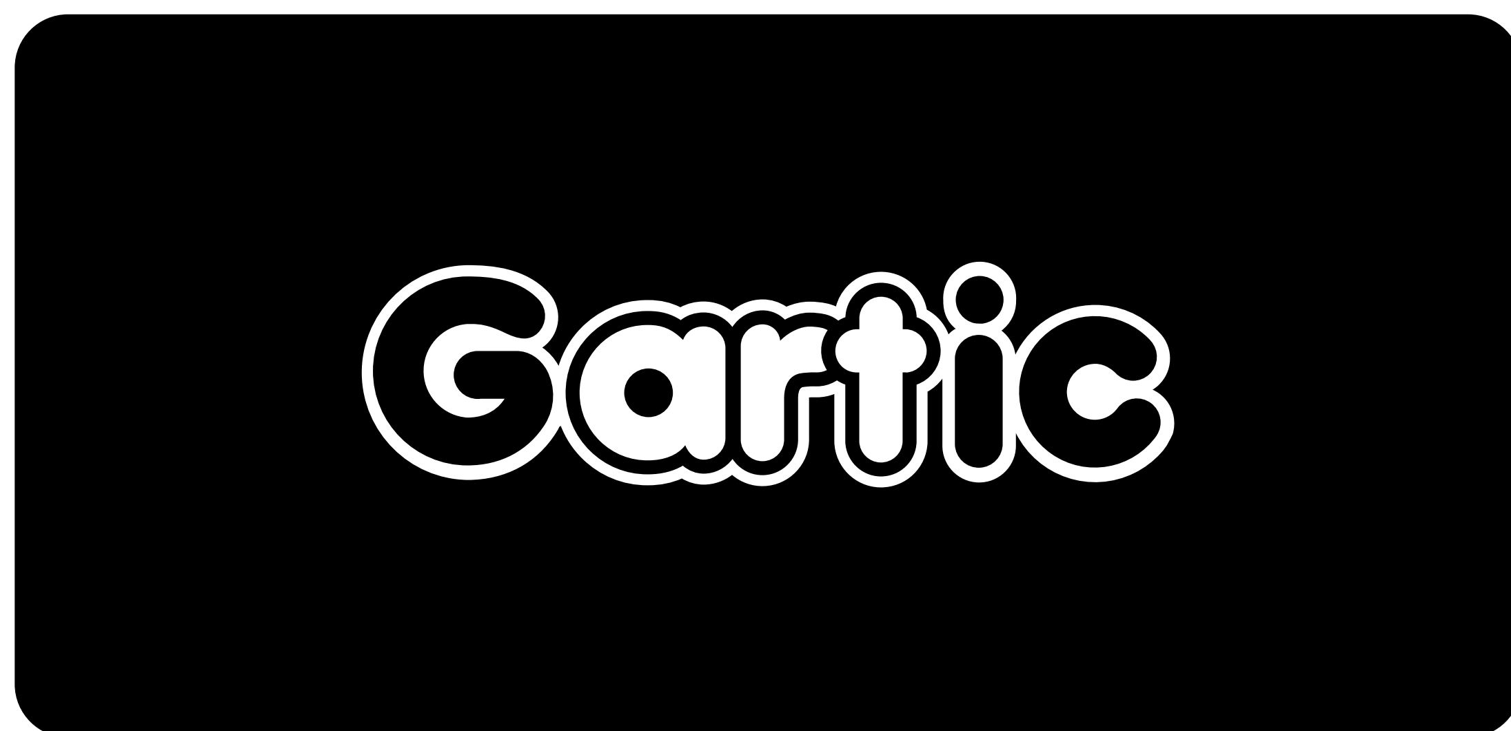
Cor de fundo preta