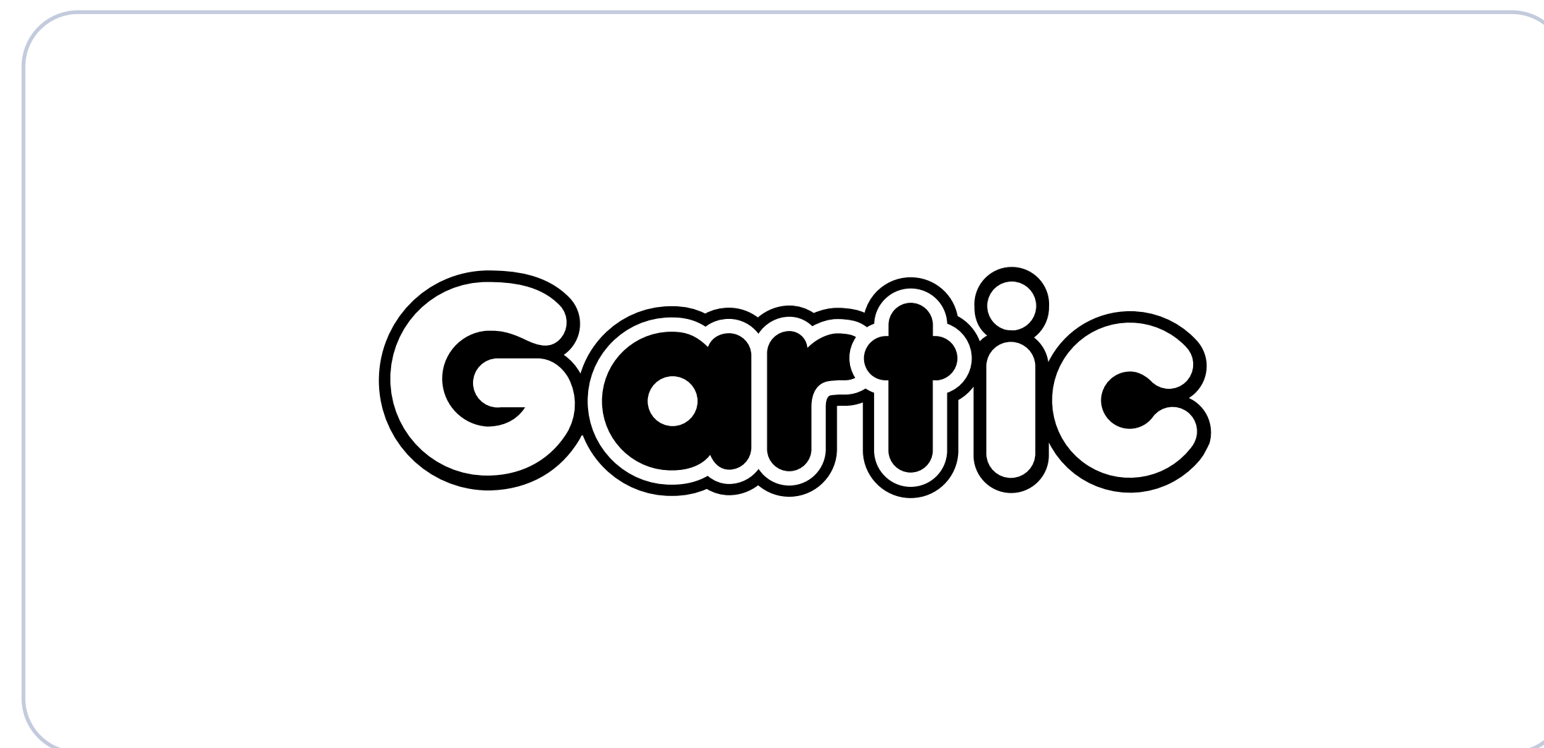
Cor de fundo branca