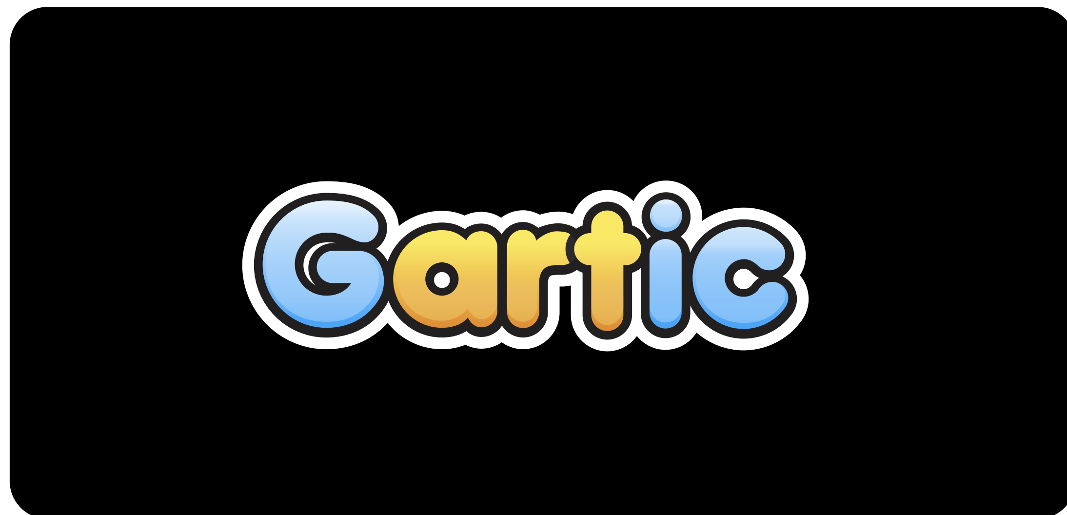
Cor de fundo preta