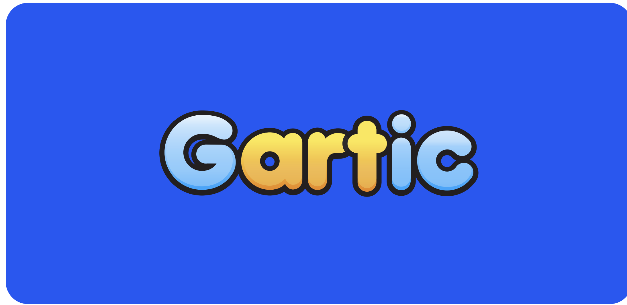
Cor de fundo azul