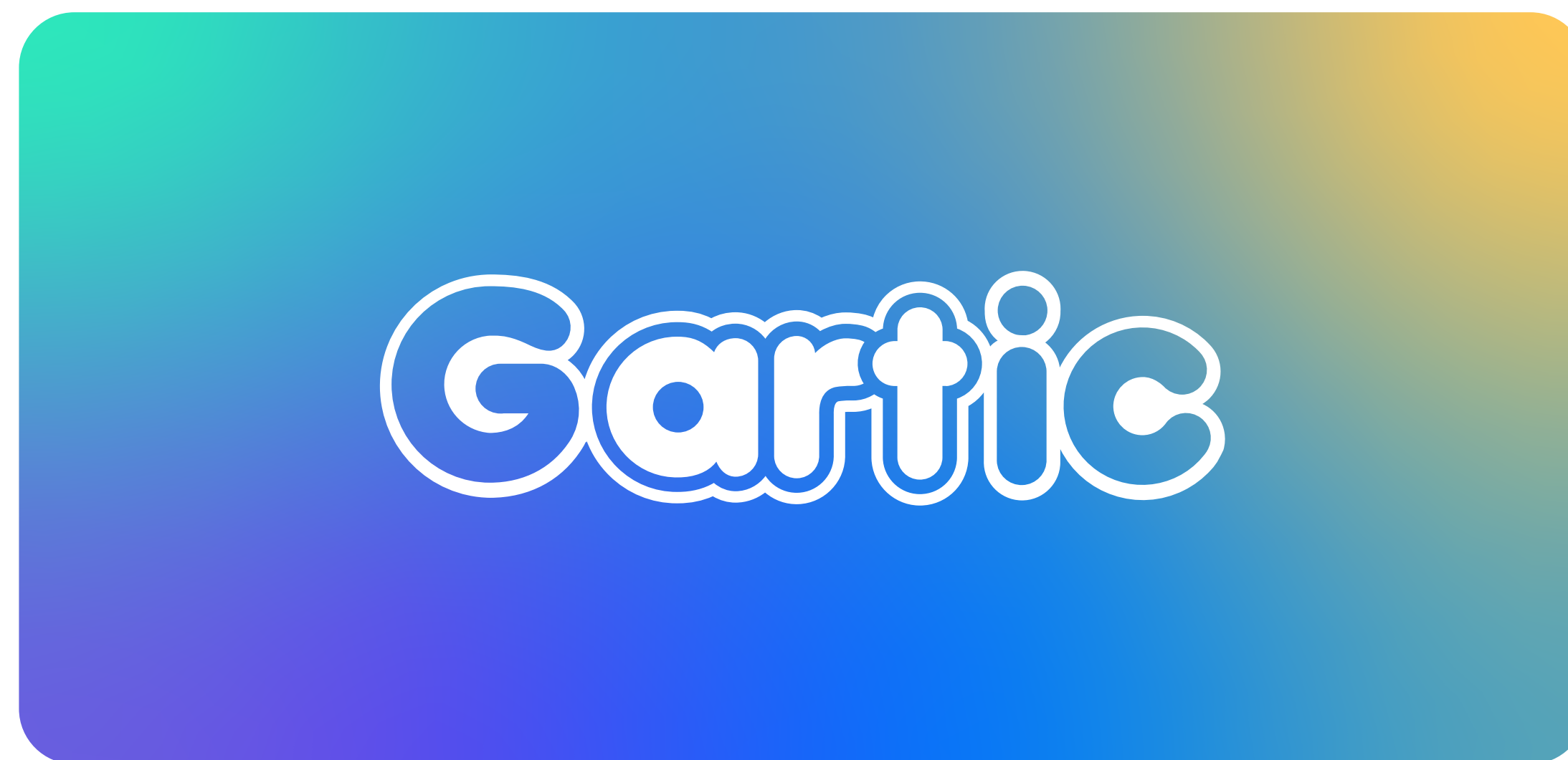
Fundo em degradê