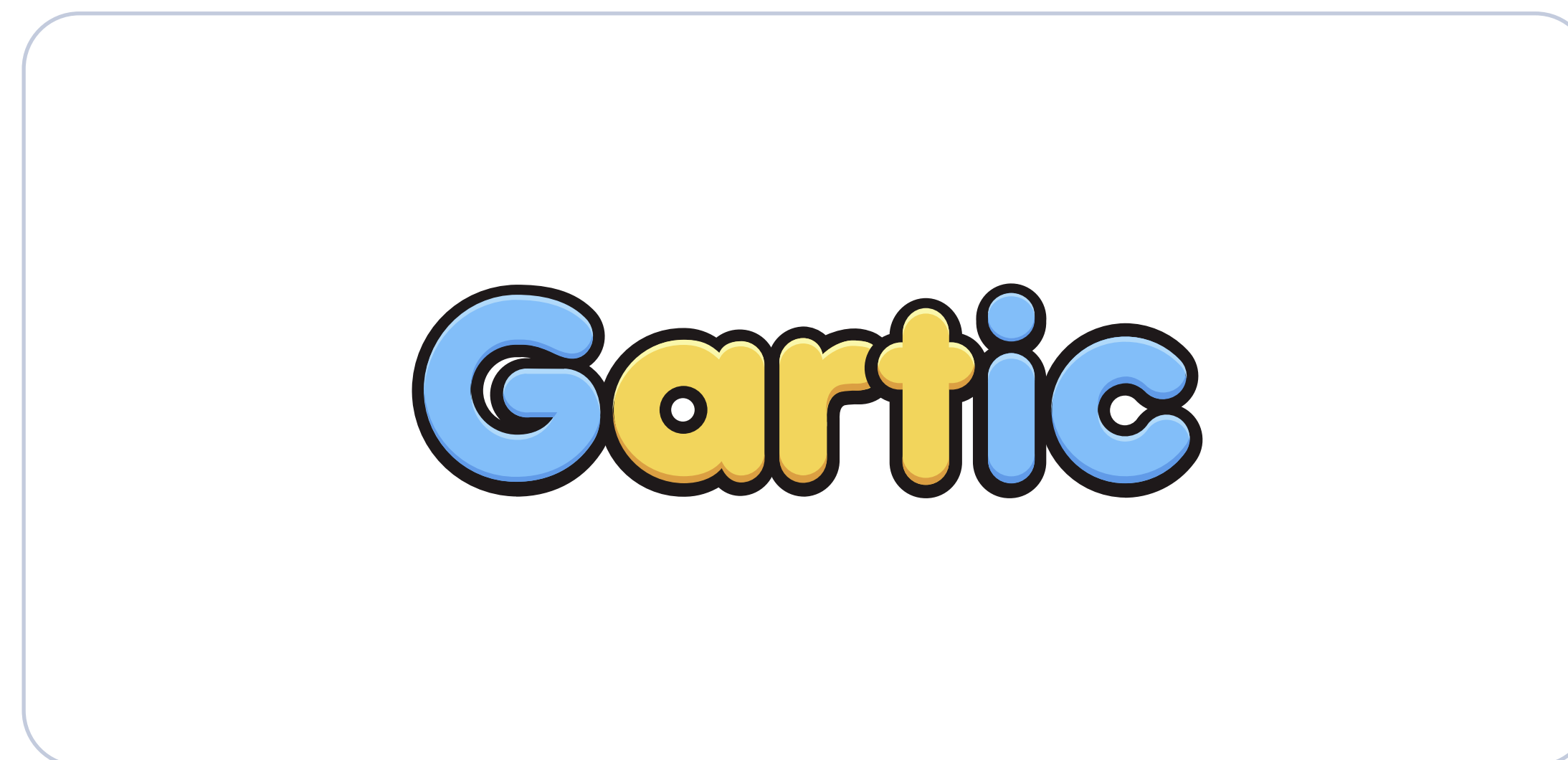
Cor de fundo branca