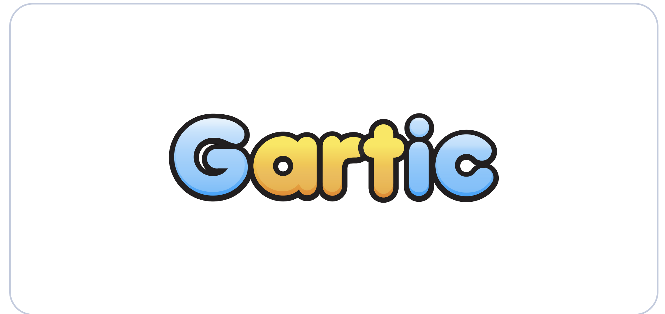
Cor de fundo branca