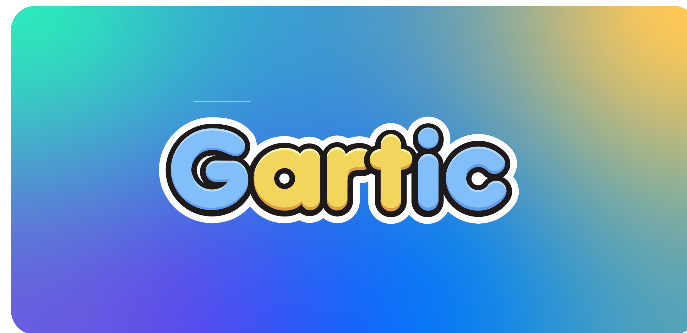
Fundo em degradê