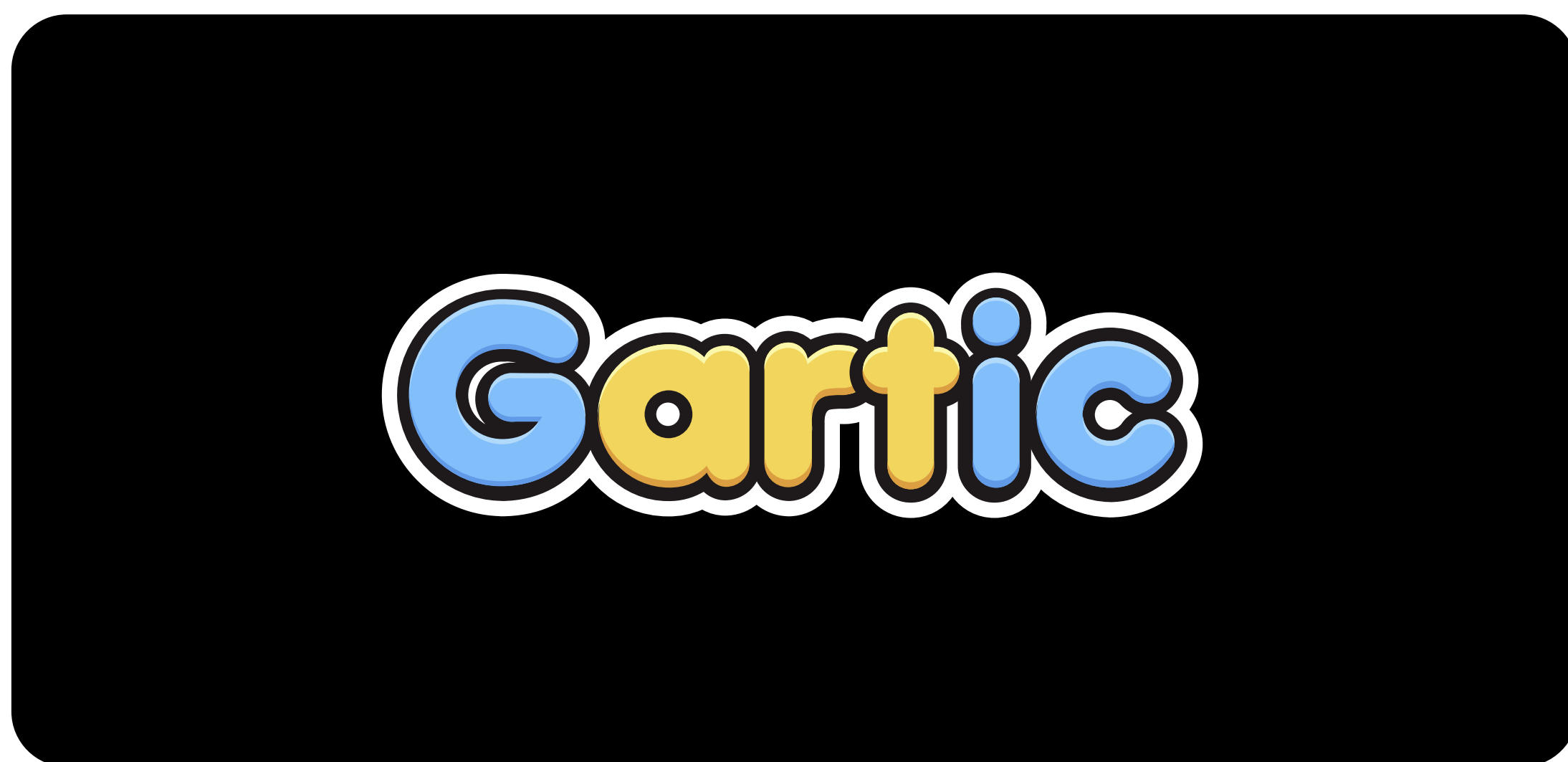
Cor de fundo preta