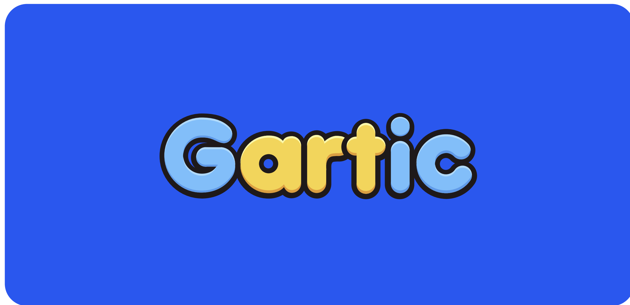
Cor de fundo azul