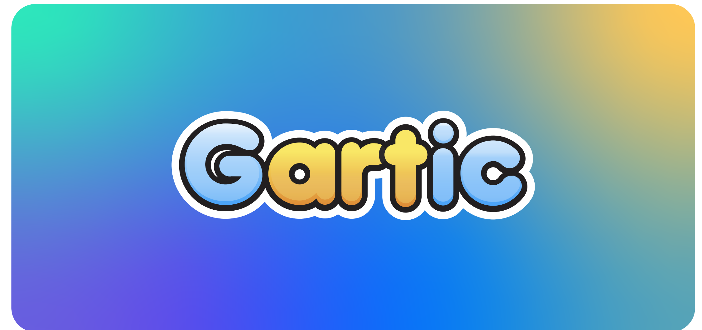
Fundo em degradê